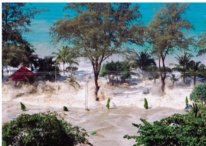
Figura 1 Gli tsunami sono provocati da terremoti sottomarini che determinano un violento sollevamento della massa d'acqua.

(Alcune parti di questo approfondimento fanno riferimento ai contenuti del sito: http://www.scienzagiovane.unibo.it/tsunami.html )