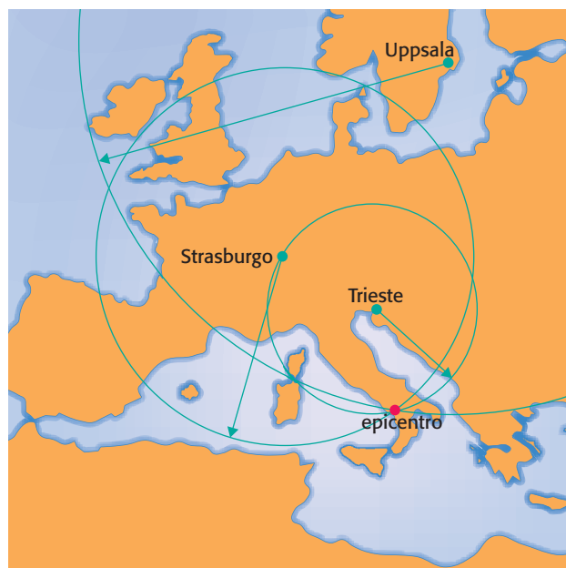
Figura 2 Per localizzare l'epicentro è necessario conoscerne la distanza da almeno tre stazioni sismiche. Si tracciano su una carta geografica le tre circonferenze che hanno come centro le località in cui si trovano i sismografi; le tre curve si incroceranno tra loro in un solo punto che individua l'epicentro del terremoto.

Se l'intervallo tra l'arrivo delle onde P e di quelle S