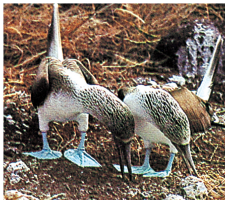
Figura 1 Il corteggiamento delle sule a zampe blu. Il corteggiamento ha la funzione di mettere il maschio e la femmina di una specie nelle condizioni che possano assicurare la fecondazione, sincronizzando i loro ritmi sessuali.

• Molti animali sono in grado di orientarsi in modo veramente sorprendente. Un tipo semplice di orientamento è la cinesi , un movimento senza una precisa direzione. Alcuni insetti, per esempio, come il pidocchio del legno, si muovono fino a che non trovano un ambiente con il giusto tasso di umidità. La tassia è invece il movimento diretto verso, o a volte contro, la fonte di un particolare stimolo: il girasole orienta le proprie infiorescenze verso la luce, molte farfalle sono attratte dalla luce, le tartarughe marine si orientano verso il mare. Una forma più complessa è l' orientamento a bussola , utilizzato dagli uccelli migratori: essi volano per migliaia di chilometri ogni anno e ritornano ai luoghi di origine, usando come indicatori di direzione le stelle.