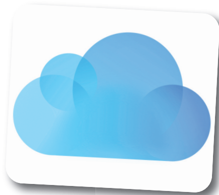
Timeline della storia di Internet fino all'era del cloud.